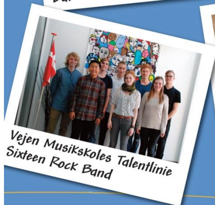
Vejen Musikskoles Talentlinie Sixteen Rock Band