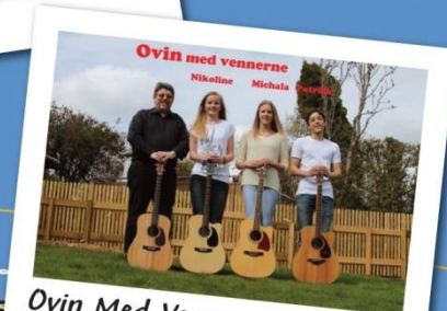
Ovin Med Venner